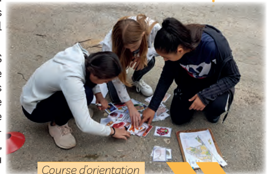
Course d'orientation des 6èmes du collège Claudel

Au collège Camille Claudel, le CoDEPS 13 est intervenu auprès des élèves de 6ème pour travailler sur les rythmes de vie. La création de petites scènes de théâtre par les élèves a eu lieu, suivie d'une grande course d'orientation intégrant des petits jeux sur l'alimentation, le sommeil et les écrans dans le Parc du Griffon.