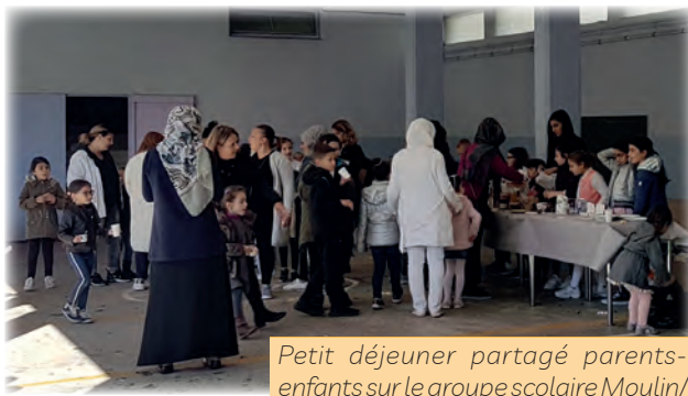
Petit déjeuner partagé parents-enfants sur le groupe scolaire Moulin/Raumettes/Parc Méditerranée