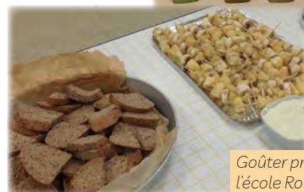
Goûter préparé par les CM1/CM2 de l'école Robert Desnos