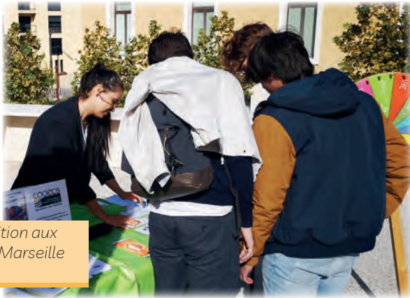
Stand nutrition aux RSBE d'Aix Marseille Université