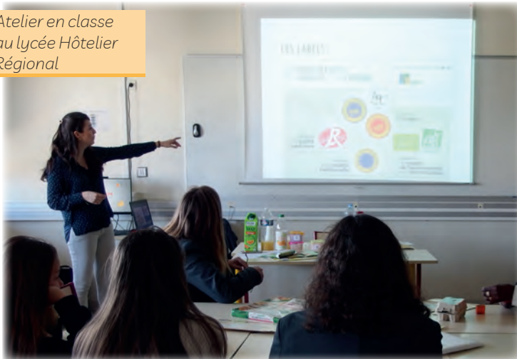
Atelier en classe au lycée Hôtelier Régional

Chaque année, deux réunions régionales réunissent l'ensemble des acteurs régionaux impliqués dans ce projet.