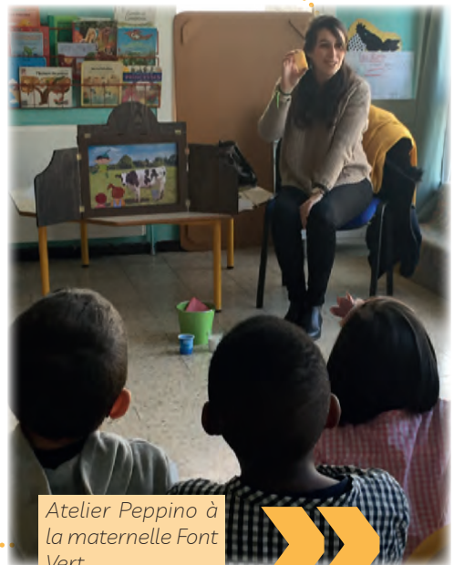
Atelier Peppino à la maternelle Font Vert

En parallèle, nous avons réalisé des ateliers cuisine avec les femmes de l'association.